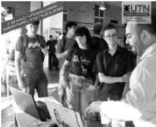
Expo Empleo UTN Avellaneda 2026 27 de mayo • Campus UTN Avellaneda • Ramón Franco 5050

La Expo tendrá lugar en el Patio Cubierto del Campus Villa Domínico (av. Ramón Franco 5050), en el horario de 16.30 a 20.30, con entrada libre y gratuita.